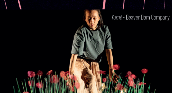
Yumé - Beaver Dam Company