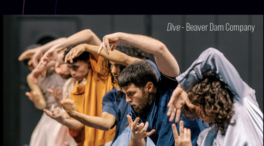
Dive - Beaver Dam Company