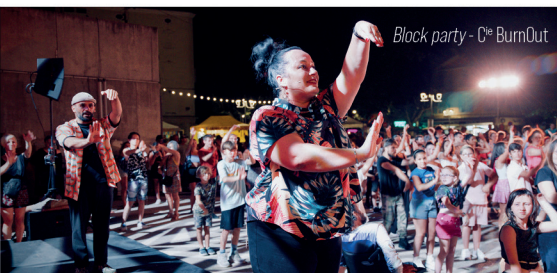
Block party - C ie BurnOut