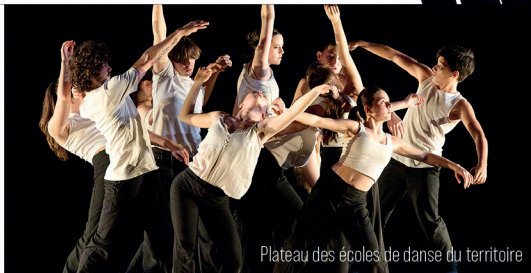
Plateau des écoles de danse du territoire